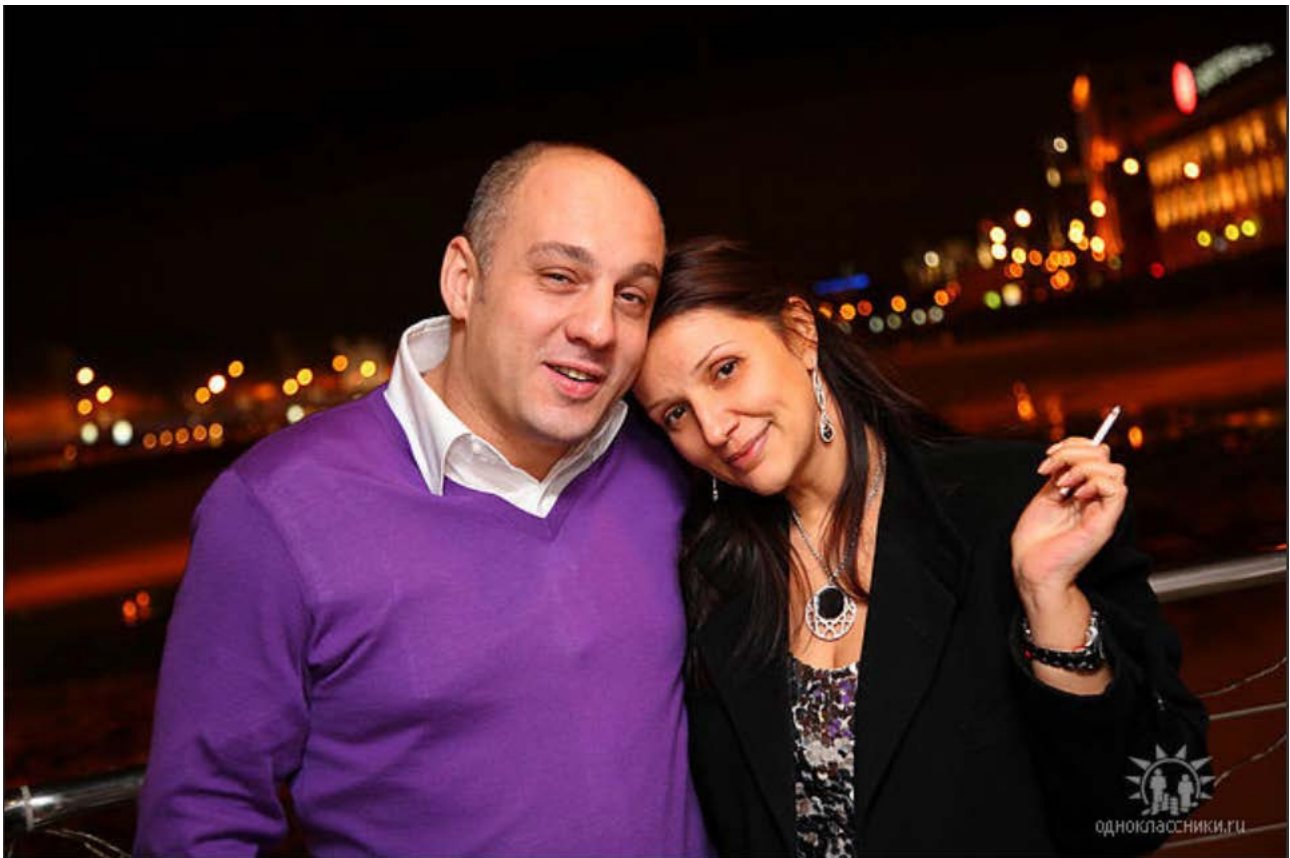
(На фото с супругой)